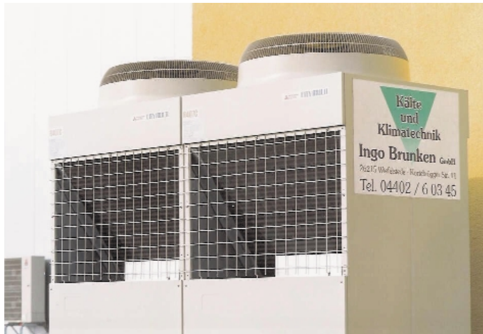
... als auch die Außengeräte arbeiten sehr leise

Diese Tatsache hat auch Auswirkungen auf die Stromtarife der einzelnen Energieversorger. Die IPM (Intelligenz-Power-Modul-Technologie) ist die neueste Generation der Invertertechnik mit stufenloser Leistungsanpassung in 85 Ein-Herz-Schritten über den gesamten Leistungsbereich.