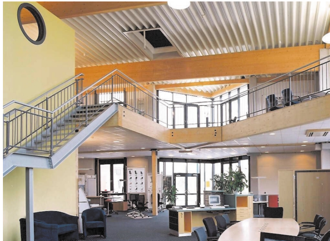
Sowohl die Inneneinheiten, hier im Falle von 2 Wege-Kassetten, ...

Da Heizungs- und Klimaanlage immer auf maximal Werte ausgelegt werden, die aber nur stundenweise an wenigen Tagen im Jahr auftreten, überwiegt der Teillastbereich. Diese Feststellung war ein wichtiges Kriterium bei der Auswahl des Herstellers. Nach ausgiebigen Vergleichen aller Hersteller fiel letztendlich die Wahl auf ein Produkt von Mitsubishi-Electric. Ein ausschlaggebender Punkt dabei war, daß Mitsubishi-Electric einziger Hersteller auf dem deutschen Markt ist, der bis zu einem Leistungsbereich von 28 KW Kälteleistung (31,5 KW Heizleistung) mit nur einem drehzahlgeregelten Scrollverdichter arbeitet. Der Wettbewerb schaltet bei Erreichung von 50 % der Gesamt-Kühl- bzw. Heizleistung einen unregelmäßig statischen Verdichter zu, der dann Anlaufströme von über 70 A erzeugt. Bei Mitsubishi Electric-Produkten ist durch die individuelle Invertertechnik gewährleistet, daß über den gesamten Leistungsbereich maximale Anlaufströme von 12 A nicht überschritten werden.