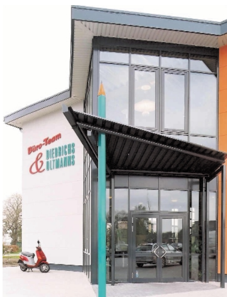
Das neue Gebäude von Büro-Team Diedrichs & Oltmanns wird komplett mit einem modernen VRF-System beheizt und gekühlt

Als das Objekt Büro-Team Diedrichs & Oltmanns geplant wurde, stand zunächst nicht fest, wie die Versorgungstechnik aussehen sollte. Insbesondere die Themen Beheizung und eventuelle Klimatisierung waren offen. Die folgende Reportage verdeutlicht, welche Möglichkeiten in der VRF-Klimatechnik liegen, um derartige Projekte Energie optimiert und kostengünstig zu beheizen und zu klimatisieren und um sie gegen derzeit noch weit verbreitete konventionelle Heiztechnologien zu behaupten.